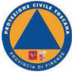
Provincia di Firenze Servizio Protezione Civile