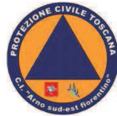
Centro Intercomunale Arno Sud-Est Fiorentino