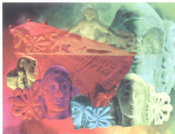
Sarcofago delle Amazzoni , stampa digitale, 2010