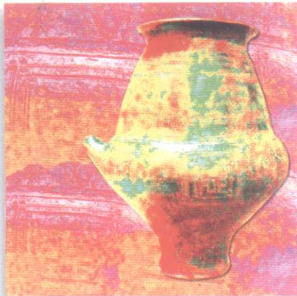
Scrigno segreto , 2013, stampa digitale

l'artista avviò una riflessione sul processo tecnico, mentale e emotivo che porta alla realizzazione delle sue opere. In quella conversazione fu individuata la percezione come la madre delle idee e delle azioni che determinano i suoi lavori. La forza della percezione, infatti, è riconosciuta dai filosofi, dagli artisti e dagli psicologi come l'impatto più genuino della mente con la realtà, ed è sull'impulso dato da questa freschezza che