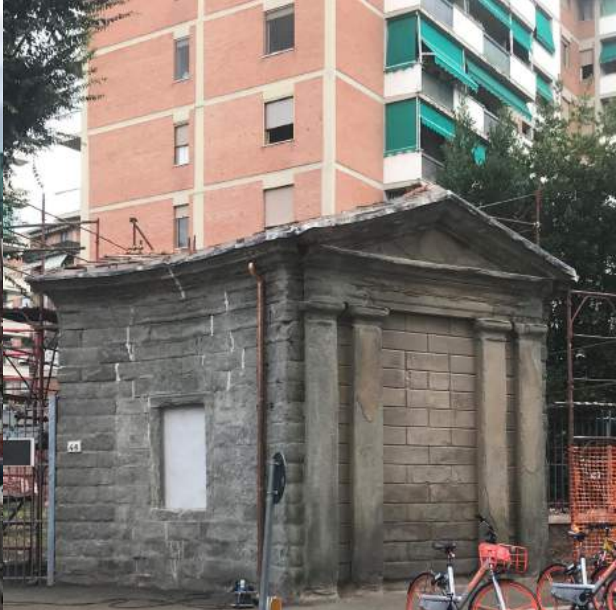
Adeg. Normativo C.P.I. € 369.503 Recupero propilei € 123.000