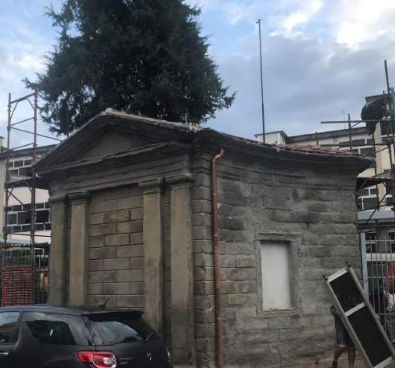
Istituto SASSETTI - PERUZZI via S. Donato 46